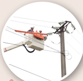
Để giảm thời gian cắt điện của khách hàng, PC Thái Nguyên áp dụng sửa chữa các tổn thất, không khuyến khích trên lưới điện bằng công nghệ hotline.

Từ cuối năm 2023 đến nay, PC Thái Nguyên hoàn thành lắp đặt điện áp 50/0,4 kV trạm biến áp mới với tổng công suất 18.200 kVA. Số công tơ đang được lắp đặt nhanh tiến độ triển khai thực hiện, đảm bảo đóng điện trước ngày 30/4/2024.