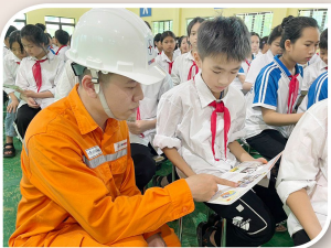
Điện lực Võ Nhai tuyên truyền đến học sinh về sử dụng điện tiết kiệm và an toàn, hiệu quả.