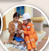
Nhân viên Điện lực TP. Thái Nguyên hướng dẫn khách hàng cài đặt APP trên điện thoại thông minh để kiểm tra, theo dõi sản lượng điện tiêu thụ của gia đình.