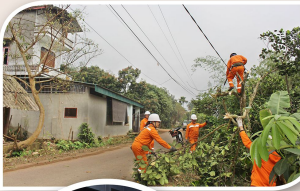
Cùng với các giải pháp về kỹ thuật, ngành Điện đồng loạt triển khai phát quang hàng ngàn tuyến. Đến hết quý I/2024, PC Thái Nguyên phải cắt đi 5.020 cây, cắt ngọn (tạ cành trên 10.400 cành) đảm bảo khoảng cách an toàn quy định.