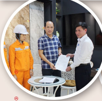
Kêu gọi các khách hàng lớn tham gia ký kết thực hiện Chương trình điều chỉnh phụ tải điện là một trong những giải pháp mà PC Thái Nguyên đang tích cực triển khai thực hiện nhằm đảm bảo nguồn cung ứng điện vào mùa nắng nóng. Trong ảnh: Nhà máy gạch đỏ xã Việt Yên, Sông Công - Chi nhánh Công ty CP Tập đoàn đầu tư Grand home ký thỏa thuận điều chỉnh phụ tải.