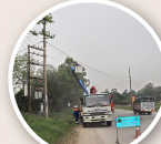
Cùng với thi công sửa chữa hotline, trong quý I/2024, PC Thái Nguyên thực hiện được 204 phiên vệ sinh hotline.