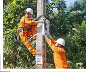
Điện lực Đông Hội đang đẩy nhanh tiến độ lắp đặt công tơ điện tử cho khách hàng.

Từ cuối năm 2023 đến nay, PC Thái Nguyên hoàn thành lắp đặt điện áp 50/0,4 kV trạm biến áp mới với tổng công suất 18.200 kVA. Số công tơ đang được lắp đặt nhanh tiến độ triển khai thực hiện, đảm bảo đóng điện trước ngày 30/4/2024.